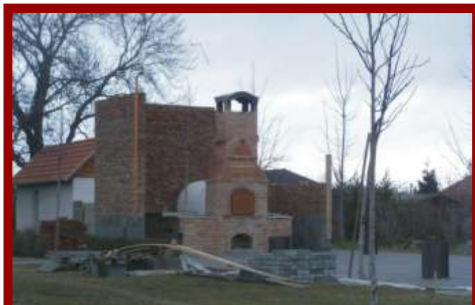
Fedést és térkövezést kap a dinnyési hagyomány r z ben lév közösségi kemence. Gárdony város önkormányzata sikeres Leader-pályázat eredményeképpen tudja megvalósítani a fejlesztést, a munkák tavaszra fejez dnek be.