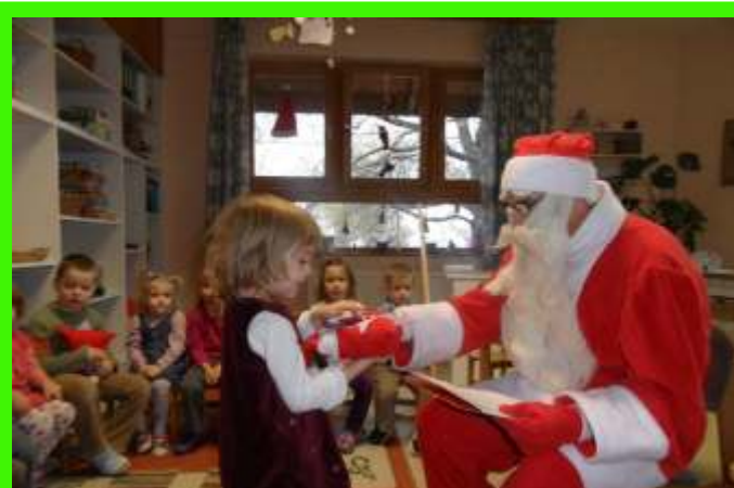
A város óvodáiba idén is ellátogatott a Mikulás, sok örömteli pillanatot szerezve ezzel. A kép a gárdonyi óvodában készült.